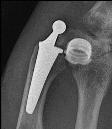
1 luxation (4,3 %)

=> Bons résultats fonctionnels (idem série globale)