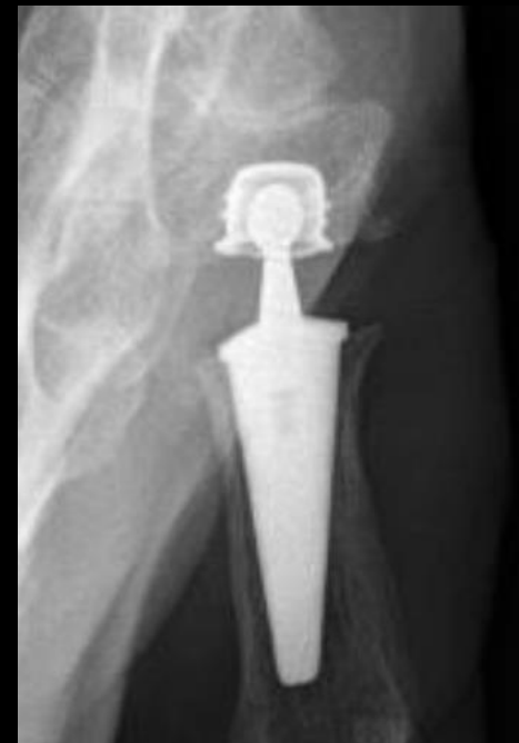
FU : 8 ans