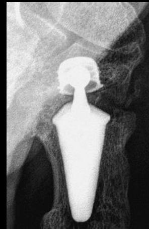
4 calcifications péri-prothétiques (17.4%)